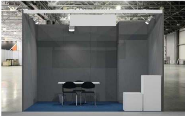
ST132 - LINEAR BOOTH (ONE OPEN SIDE)