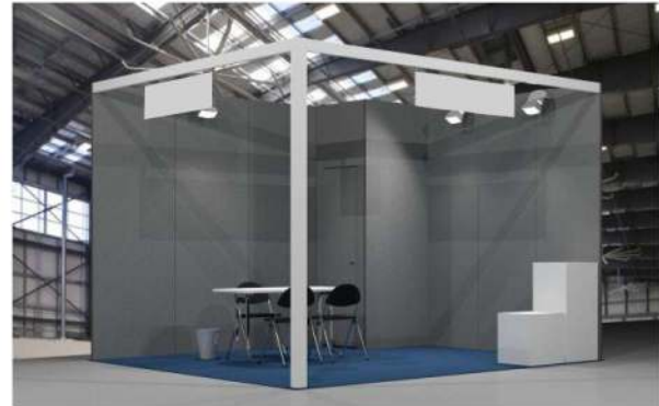
ST132 - CORNER BOOTH (TWO OPEN SIDES)

Graphics may only be attached to walls using drawing pins or headless tacks. Graphics cannot be applied to frontal sign and pillars.