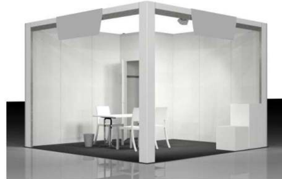
ST086 - CORNER BOOTH (TWO OPEN SIDES)

Adhesive graphics may be attached to the walls provided they are completely removable. Prints on rigid supports (such as Forex board) must be mounted using S-shaped hooks and chains attached to the upper edge of the panels.