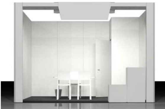
ST086 - LINEAR BOOTH (ONE OPEN SIDE)